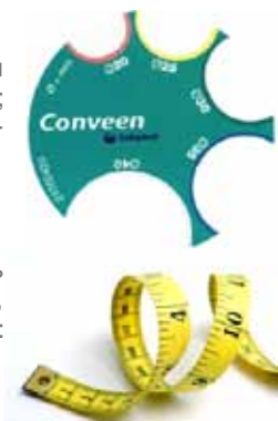
Таблица соответствий диаметра уропрезерватива и окружности полового члена

2. С помощью сантиметровой ленты, измерив окружность пениса в миллиметрах и произведя дальнейшие вычисления, воспользовавшись нижеприведенной таблицей или формулой: